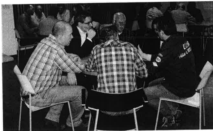
Informatieavond in gemeente Horst aan de Maas

Een gemeentebestuur dat anticipeert op de demografische ontwikkelingen ontbreekt echter nog opvallend vaak, constateert Hoekman. "In eerste instantie richten gemeenten in de krimpregio's hun beleid op