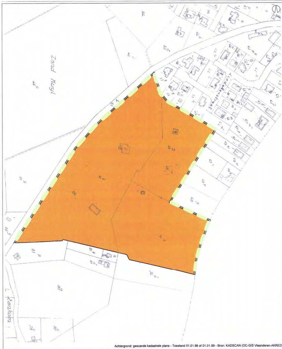
Achtergrond: gescande kadastrale plans - Toestand 01.01.98 of 01.01.99 - Bron: KADSCAN (OC-GIS Vlaanderen-AKRED)

GEWESTELIJK RUIMTELIJK UITVOERINGSPLAN TERREIN VOOR OPENLUCHTRECREATIEVE VERBLIJVEN DE SCHUUR - HERENTALS