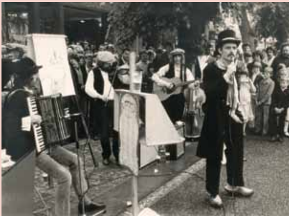
FOTO VAN DE SPILZAKKEN, TIJDENS OPTREDEN OP HEILIG BLOEDKERMIS IN HOOGSTRATEN