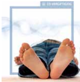
Hou de stille moordenaar buiten!