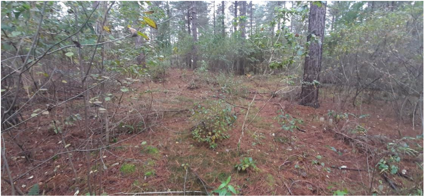
Figuur 3 – Plaatselijk zijn de Celtic Field wallen in het terrein duidelijk herkenbaar (terreinbezoek 30-10-2023)