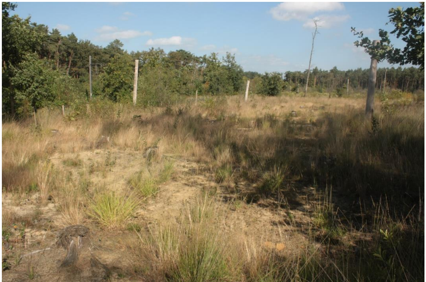
Figuur 4 – Zicht op het afgeplagde terrein op 19-09-2018